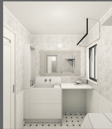
打合せ中のスケッチとイメージCG